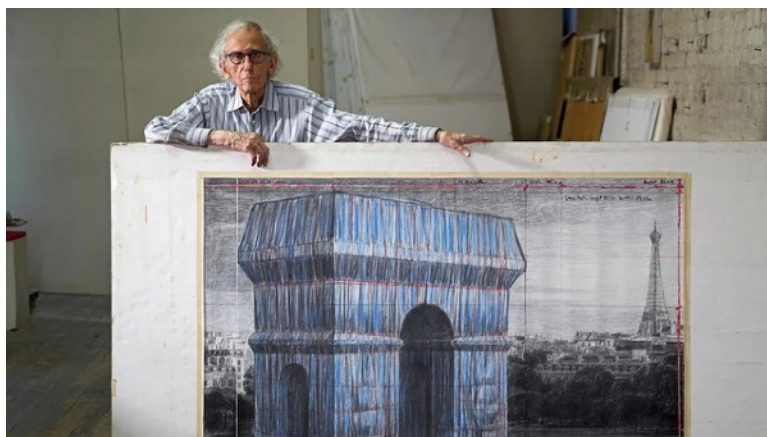
Christo dans son studio, New York, 2019

En Octobre 2021 , une vente aux enchères permettait de réunir les fonds nécessaires à emballer l'Arc de Triomphe parisien, en hommage à la mémoire de l'artiste, décédé en 2020.