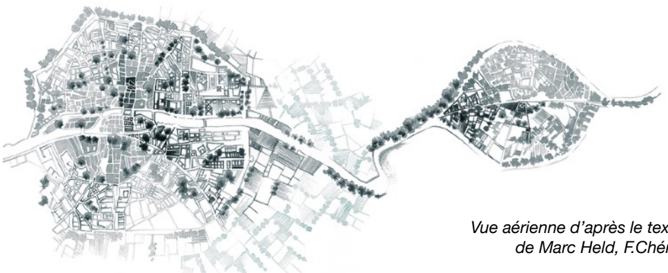
Vue aérienne d'après le texte de Marc Held, F.Chérel